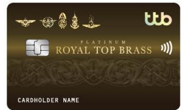
ttb royal top brass