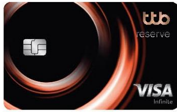
ttb reserve infinite