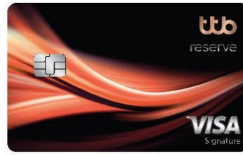
ttb reserve signature