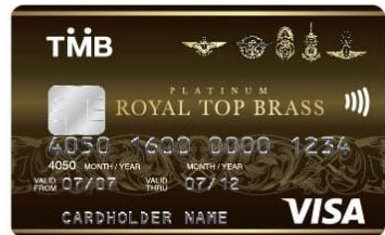
TMB Royal Top Brass