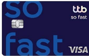
ttb so fast