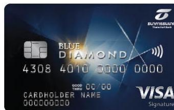
TBANK Blue Diamond