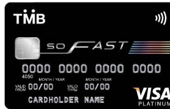
TMB So Fast